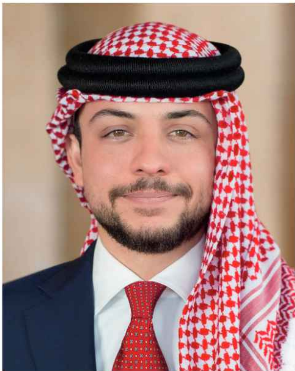
ولي العهد الأمير الحسين بن عبدالله الثاني